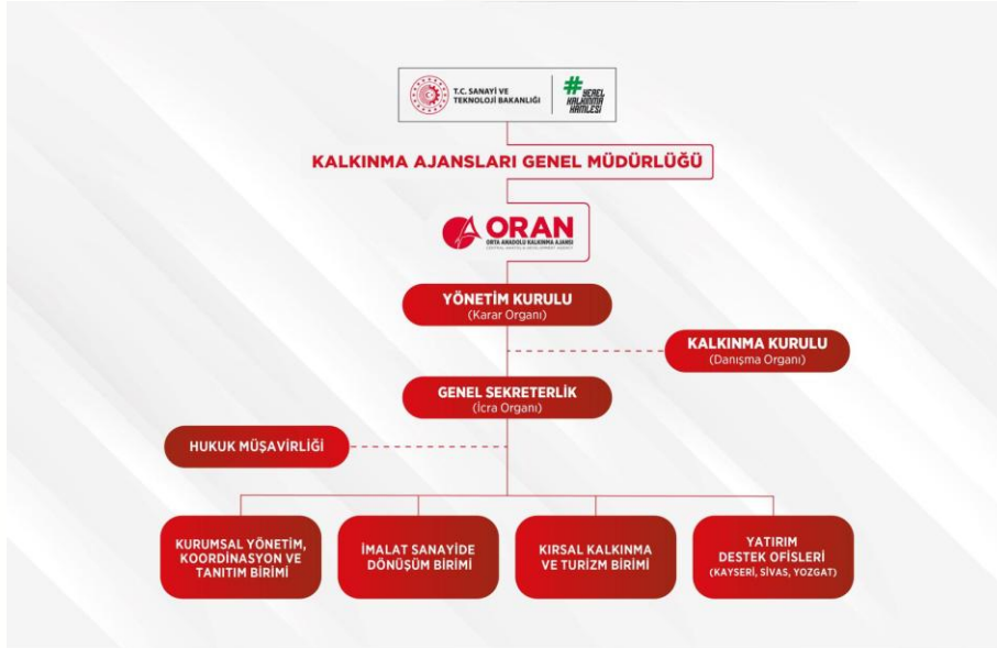
Şekil 1. Organizasyon Şeması

Ajansın teşkilat yapısı 4 sayılı Cumhurbaşkanlığı Kararnamesinin on altıncı bölümünün 190'ıncı maddesiyle belirlenmiştir. Buna göre; Ajans Kalkınma Kurulu, Yönetim Kurulu, Genel Sekreterlik ve Yatırım Destek Ofislerinden müteşekkildir. Aynı kararnamenin ilgili maddelerine göre Yönetim Kurulu karar organı, Kalkınma Kurulu danışma organı ve Genel Sekreterlik icra organıdır. Orta Anadolu Kalkınma Ajansı Genel Sekreterliği idari yapılanma olarak; İmalat Sanayide Dönüşüm Birimi, Kırsal Kalkınma ve Turizm Birimi, Kurumsal Yönetim Koordinasyon ve Tanıtım Birimi olmak üzere 3 birim ve Kayseri, Sivas ve Yozgat illerinde birer olmak üzere 3 yatırım destek ofisinden (YDO) oluşmaktadır.