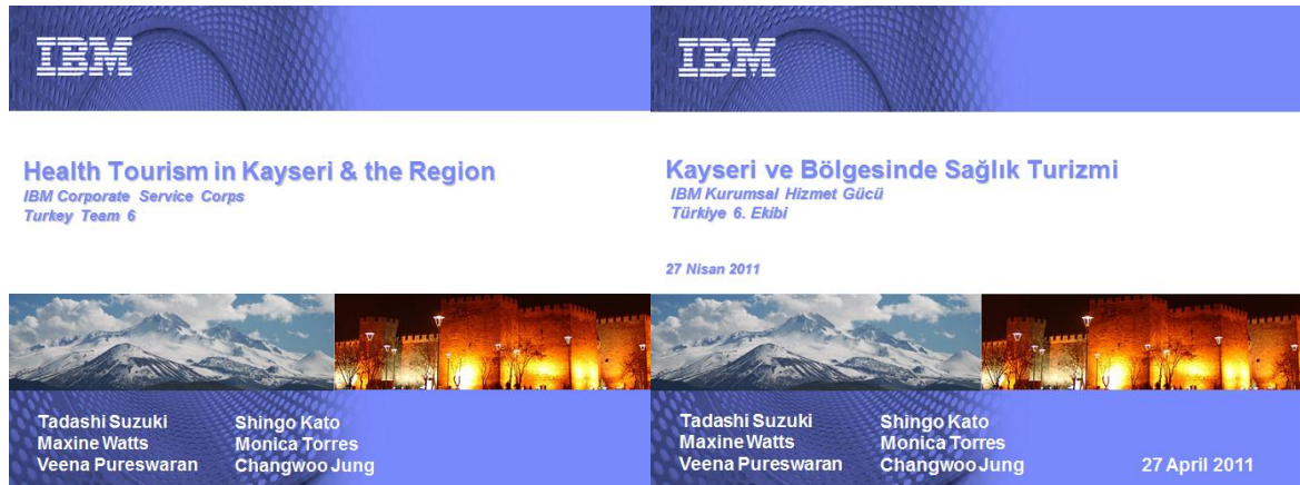
Resim 31 - Sağlık Turizmi Raporu

04-29 Nisan tarihleri arasında, IBM uzmanları ve ORAN uzmanları işbirliğinde genç girişimcilik ve sağlık turizmi konularında yerel kurumlarla görüşülerek araştırmalar yapıldı. Sağlık turizmi grubu bölgede yapılan araştırmalar ve yerelden toplanan veriler ışığında sektörün bir analizini ortaya koyarak bölgede sağlık turizminin geliştirilmesine yönelik stratejiler oluşturup bir eylem planı hazırladı. Diğer grup olan genç girişimcilik grubu ise yine yerelde yaptığı görüşmeler ve toplanan veriler ışığında bölgedeki genç girişimciliğin mevcut durumunu ve geliştirilmesine yönelik stratejiler ve bir eylem planını içeren rapor ortaya koydu. Raporların her ikisi de Türkçe ve İngilizce olarak kamuoyu ile paylaşıldı.