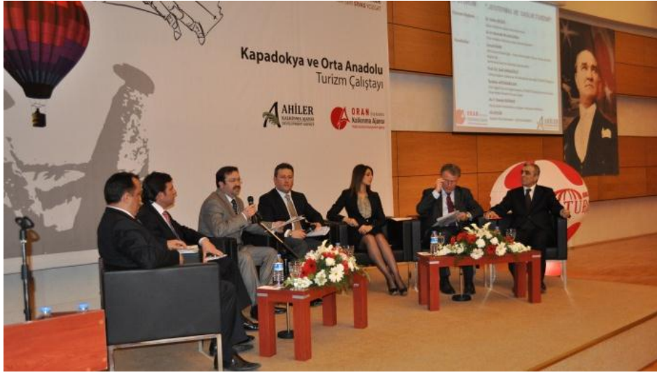
Resim 37 - Kapadokya ve Orta Anadolu Turizm Çalıştayı