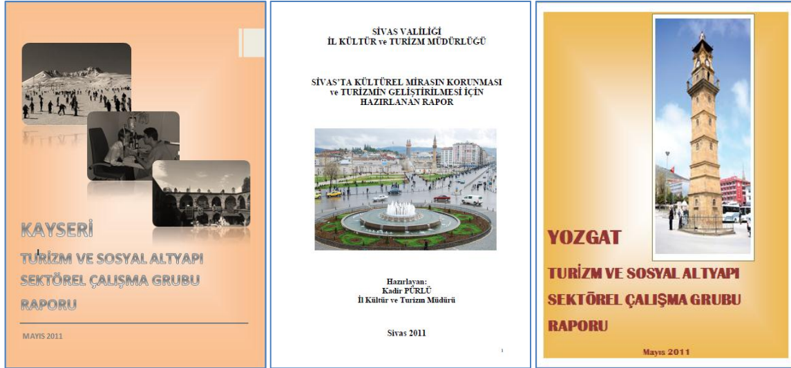
Resim 30 - Sektörel Çalışma Grubu Raporları