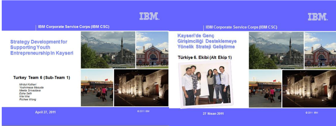
Resim 32 - Genç Girişimcilik Raporu