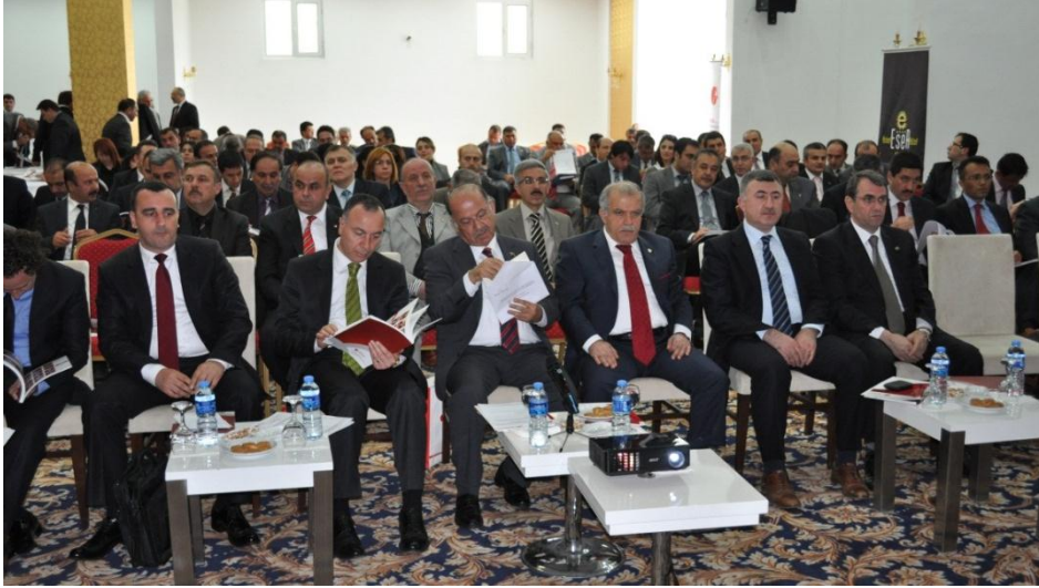
Resim 49 - 2011 Yılı I. Olağan Kalkınma Kurulu