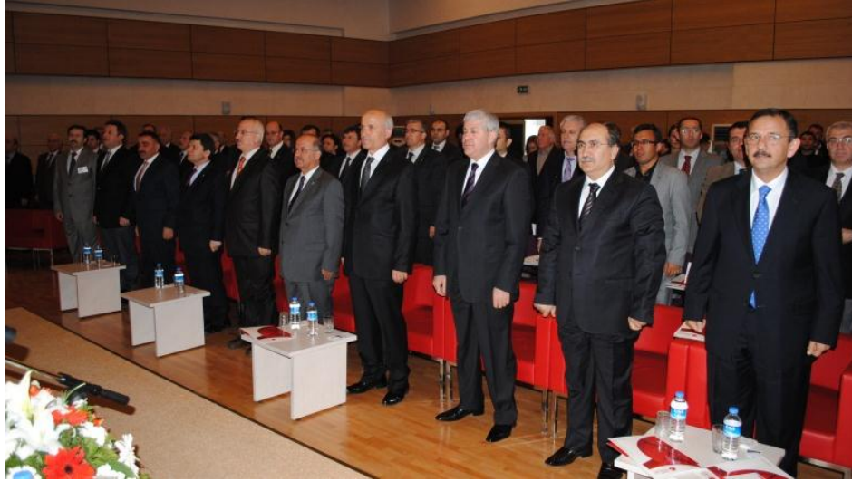
Resim 35 - Kapadokya ve Orta Anadolu Turizm Çalıştayı

Ahiler ve Orta Anadolu Kalkınma Ajansları tarafından ortaklaşa düzenlenen “Kapadokya ve Orta Anadolu Turizm Çalıştayı” 17 Mart 2011 tarihinde Kayseri Kadir Has Kongre Merkezi’nde gerçekleştirildi.