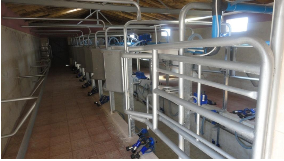
Resim 22 - Süt Toplama Merkezi Ziyareti

Kayseri Damızlık Sığır Üreticileri Birliğinden uzmanlar eşliğinde hayvansal üretimle uğraşan işletmeler ve süt toplama merkezleri gezildi ve incelendi.