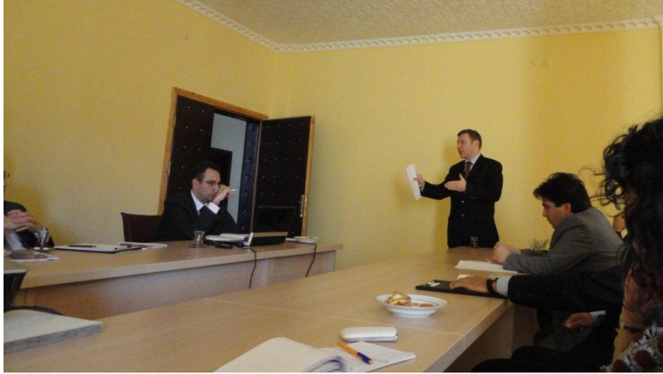
Resim 34 - Ortak Turizm Çalıştayı İstişare Toplantısı