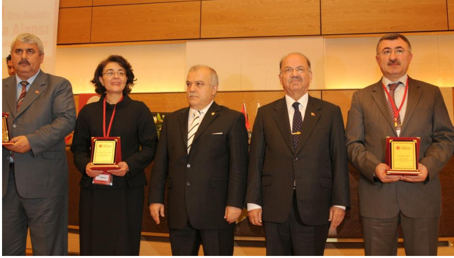
Resim 53 - 2011 Yılı II. Olağan Kalkınma Kurulu - Plaket Töreni

Plaket takdimlerinin ardından seçim esasları üyelere okunarak Kalkınma Kurulu Başkan ve Başkan Vekili seçimine geçildi.