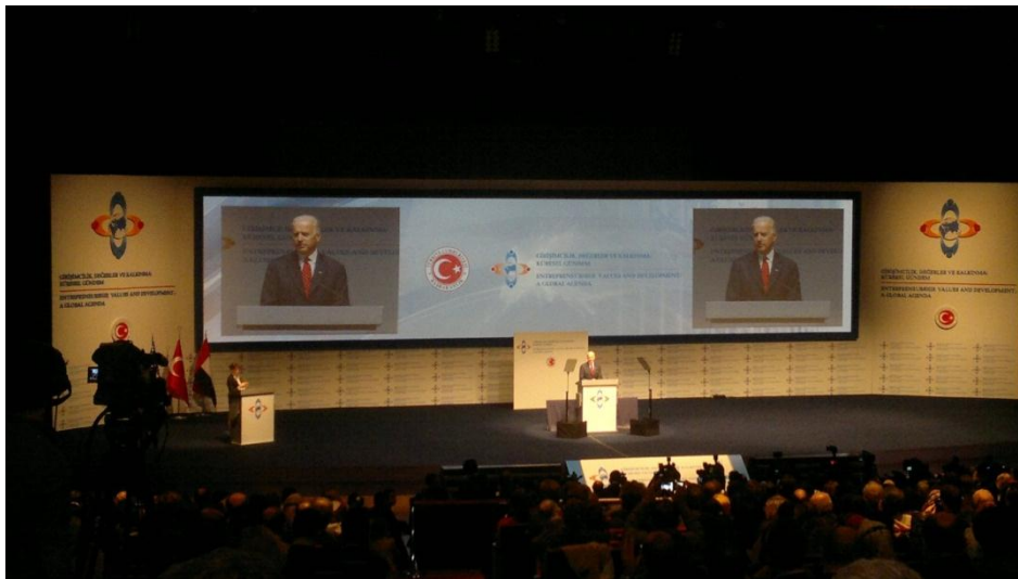
Resim 47 - Girişimcilik Zirvesi

03-06 Aralık 2011 tarihlerinde İstanbul'da gerçekleştirilen Amerikan Başkan Yardımcısı Joe BİDEN, TBMM Başkanı Cemil ÇİÇEK, Başbakan yardımcısı ve bakanların da katıldığı "Girişimcilik, Değerler ve Kalkınma: Küresel Gündem" konulu Girişimcilik Zirvesine katılım sağlandı.