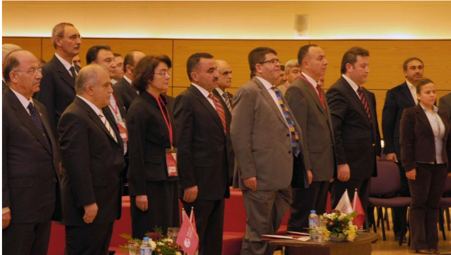
Resim 52 - 2011 Yılı II. Olağan Kalkınma Kurulu Toplantısı - Açılış