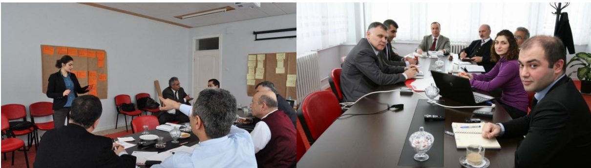
Resim 9 - Sivas Enerji ve Madencilik Sektörel Çalışma Grubu II. ve III. Toplantıları

İl Kalkınma Kurulları ile Kayseri, Sivas ve Yozgat illerinde oluşturulan Enerji ve Madencilik Sektörel Çalışma Grubu Toplantıları ile toplamda Kayseri'de 3, Sivas'ta 4 ve Yozgat'ta 3 olmak üzere 10 toplantı yapıldı. "Kart Tekniği" ve "Goals Grid" yöntemlerinin kullanıldığı toplantılarda sektörün bölge illerindeki durumu, içerdiği sorunlar ve bu sorunlara yönelik çözüm önerileri irdelendi.