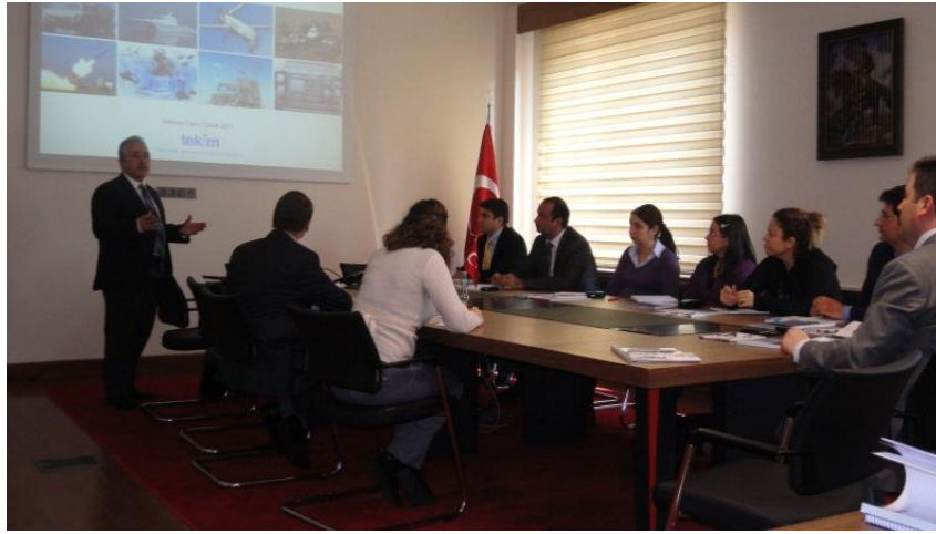
Resim 1 - Savunma Sanayi ve Tedarik Sistem Eğitimi