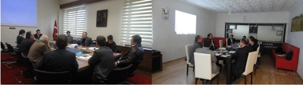
Resim 10 - Kayseri ve Sivas Enerji ve Madencilik Sektörel Çalışma Grubu Toplantıları