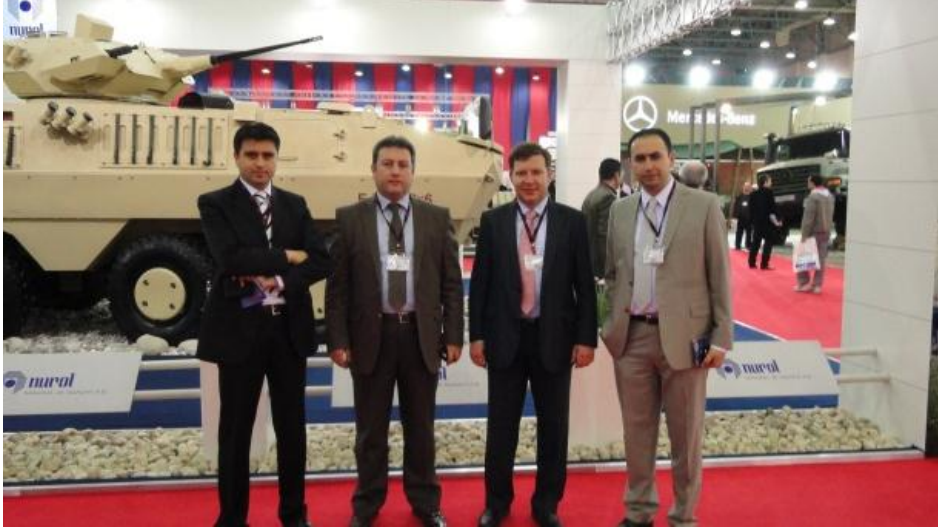
Resim 26 - 2011 IDEF Ziyareti