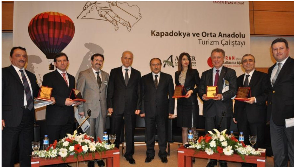
Resim 38 - Kapadokya ve Orta Anadolu Turizm Çalıştayı Plaket Töreni