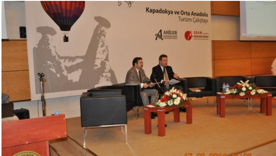
Resim 36 - Kapadokya ve Orta Anadolu Turizm Çalıştayı Panel