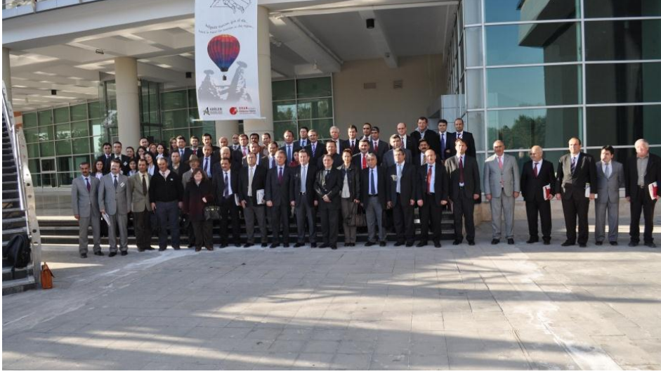
Resim 39 - Turizm Çalıştayı Hatıra Fotoğrafı

Yapılan her oturumun ardından Valiler tarafından günün anısına katılımcılara plaket takdim edildi. Sunumların ve panellerin sonrasında; katılımcıların, sektörlerine ve bölgelerine ilişkin sorunlarını dile getirdikleri soru-cevap bölümünün tamamlanması ile çalıştay sona erdi.