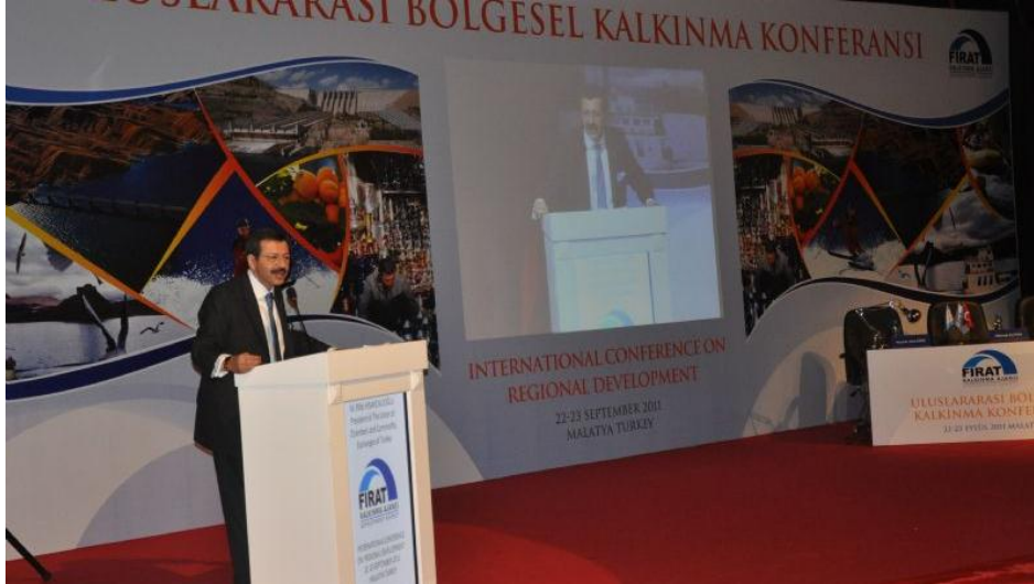
Resim 46 - Uluslararası Bölgesel Kalkınma Konferansı

Birçok ülkeden akademisyenlerin 90'a yakın bildirimleri ile katıldığı konferansta, bölgesel kalkınma alanında uzmanlaşmış 20'yi aşkın yerli ve yabancı davetli konuşmacı da yer aldı. Ayrıca ülkemizdeki tüm kalkınma ajansları temsilcileri aracılığı ile konferansa katıldı. ORAN Kalkınma Ajansı'nı ise Planlama, Programlama ve Koordinasyon Birimi uzmanları temsil etti.