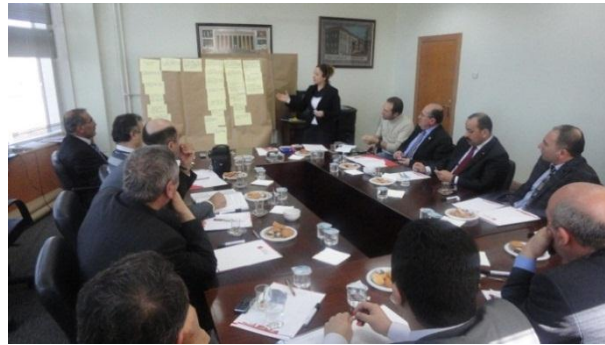
Resim 13 - Tarım, Hayvancılık ve Gıda Sektörel Çalışma Grubu Toplantıları