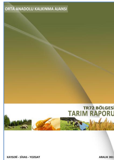
Resim 33 - Sektörel Raporlar