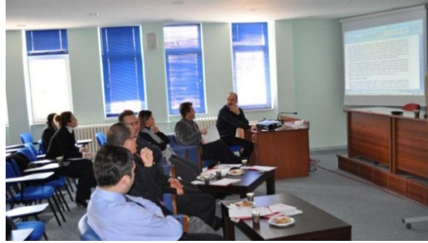
Resim 14 - Sivas Turizm ve Sosyal Altyapı Sektörel Çalışma Grubu II. Toplantısı