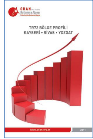
Resim 55 - TR72 Bölge Profili El Kitabı

TR72 Bölgesi ve TR72 Bölgesini oluşturan Kayseri, Sivas ve Yozgat illeri için önemli gösterge ve veriler temelinde bölge gelişmesine hizmet üzere hazırlanan bu kaynak temelde istatistiksel veri üretimi yapan kurum ve kuruluşların verileri kullanılarak derlendi ve kamuoyuna sunuldu.