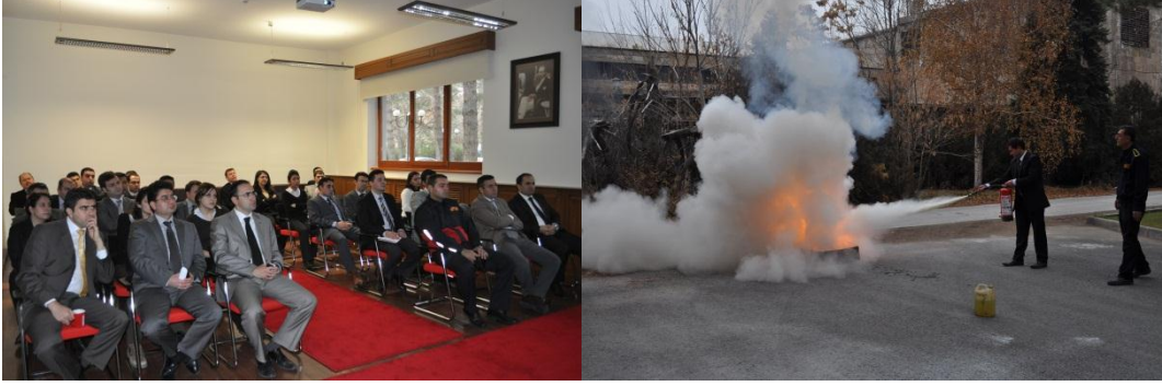
Resim 3 - Yangın Eğitimi