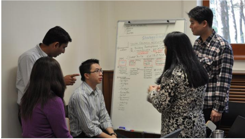
Resim 41 - IBM Kurumsal Hizmet Gücü Genç Girişimcilik Grubu Çalışmaları

Diğer grup ise Genç Girişimcilik üzerine yerel aktörlerinde katılım sağladığı çalışmalar sonucunda Genç Girişimcileri teknoloji yoğun yeni yatırımlara teşvik edecek ve Bölge'nin stratejik sektörleri olan savunma sanayi, gıda, enerji ve sağlık sektörlerinde bilişim teknolojileri (IT) kullanımını artıracak stratejileri içeren stratejiler oluşturup bir eylem planı hazırladılar.