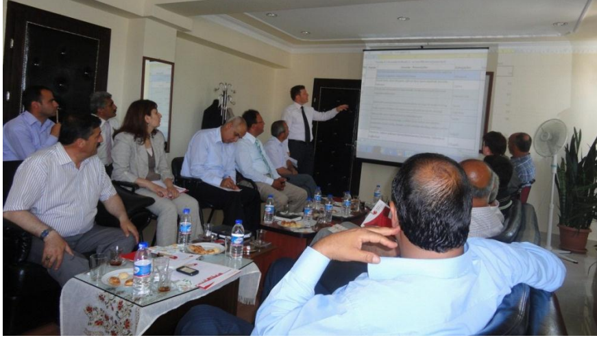
Resim 18 - Tomarza İlçe Stratejik Analiz Toplantısı