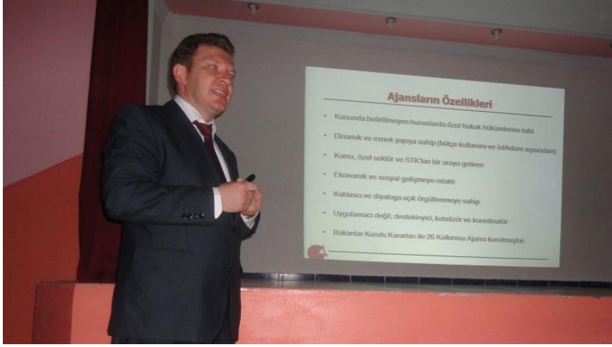
Resim 19 - Felahiye İlçe Stratejik Analiz Toplantısı