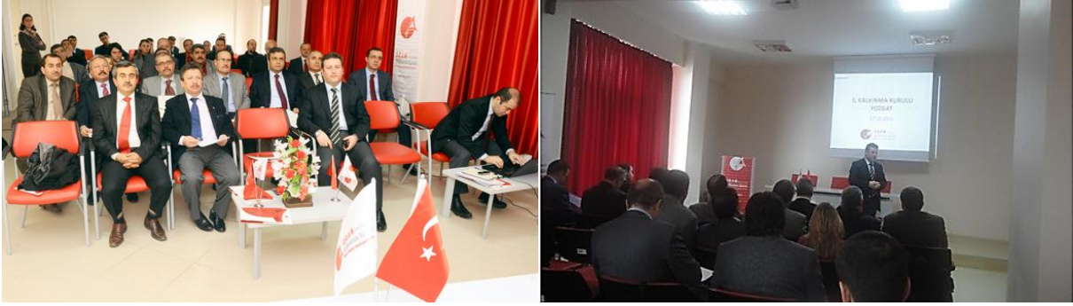
Resim 8 - Yozgat İl Kalkınma Kurulu