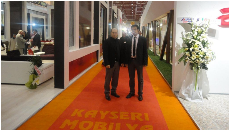
Resim 25 - Kayseri Mobilya Fuarı

Kayseri Ticaret Merkezi'nde Tüm Fuarcılık Yapım A.Ş. (TÜYAP) tarafından düzenlenen Kayseri Mobilya Fuarı ziyaret edildi.