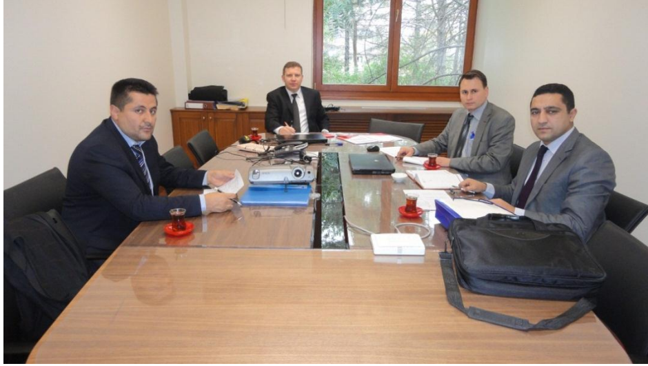
Resim 42 - TKDK Koordinasyon Toplantısı