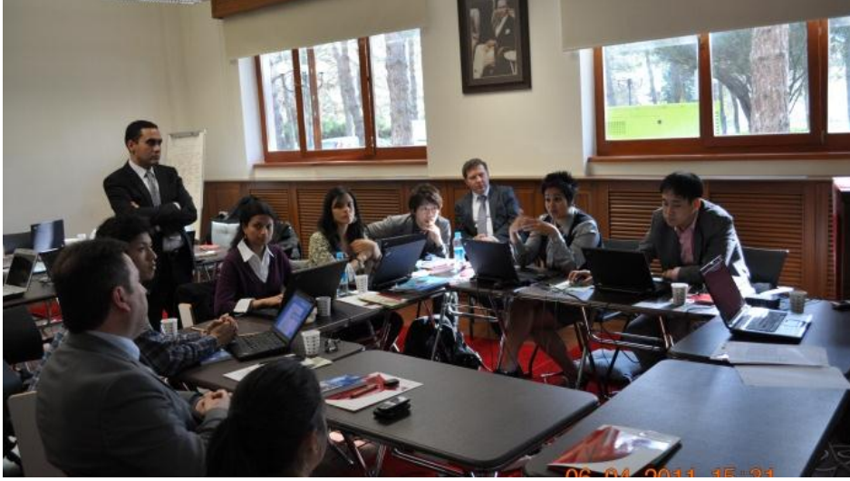
Resim 40 - IBM Kurumsal Hizmet Gücü Sağlık Turizmi Grubu Çalışmaları

Diğer grup ise Genç Girişimcilik üzerine yerel aktörlerinde katılım sağladığı çalışmalar sonucunda Genç Girişimcileri teknoloji yoğun yeni yatırımlara teşvik edecek ve Bölge'nin stratejik sektörleri olan savunma sanayi, gıda, enerji ve sağlık sektörlerinde bilişim teknolojileri (IT) kullanımını artıracak stratejileri içeren stratejiler oluşturup bir eylem planı hazırladılar.