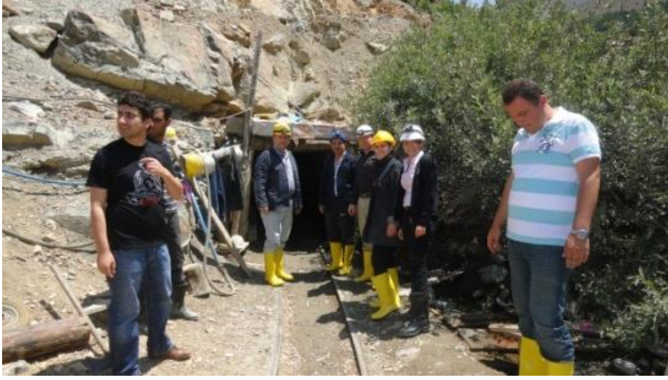
Resim 24 - Madencilik Saha Ziyaretleri