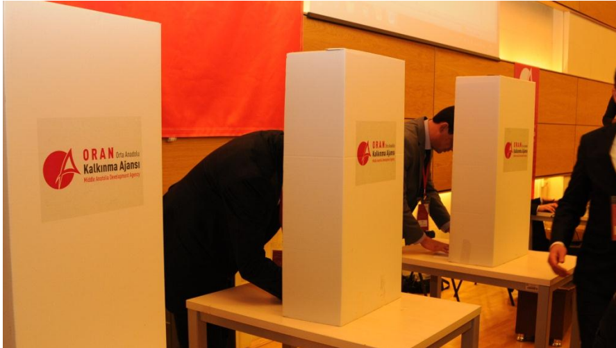
Resim 54 - Kalkınma Kurulu Başkanlık Divanı Seçimi

Plaket takdimlerinin ardından seçim esasları üyelere okunarak Kalkınma Kurulu Başkan ve Başkan Vekili seçimine geçildi.