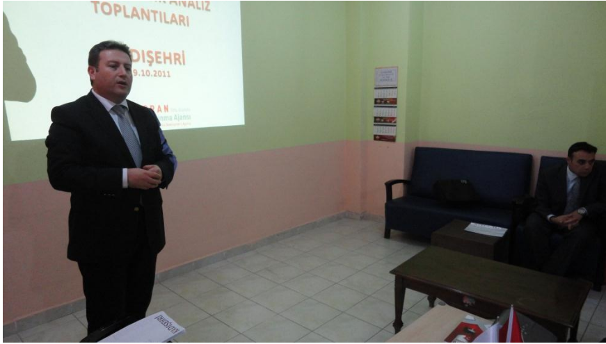
Resim 16 - Kadışehri İlçe Stratejik Analiz Toplantısı