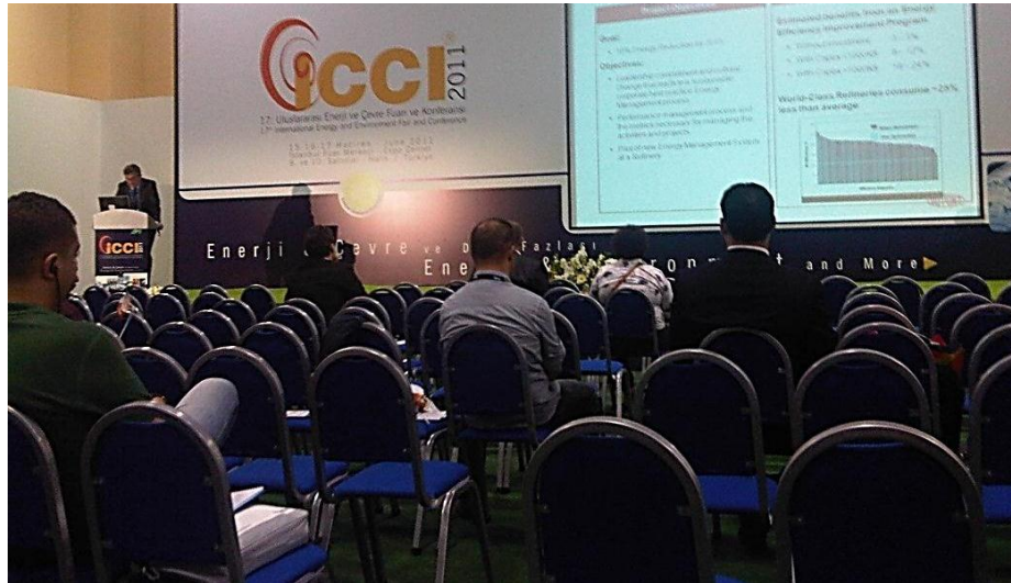
Resim 45 - 17. Uluslararası Enerji ve Çevre Fuar ve Konferansı

İstanbul Expo Center'da 17 incisi düzenlenen "Uluslararası Enerji ve Çevre Fuar ve Konferansı'na katılım sağlandı. Fuarda ulusal ve uluslararası enerji ve atık yönetimi firması ve kamu kuruluşları stantları ziyaret edildi. Düzenlenen konferansa ise dinleyici olarak katılım sağlandı.