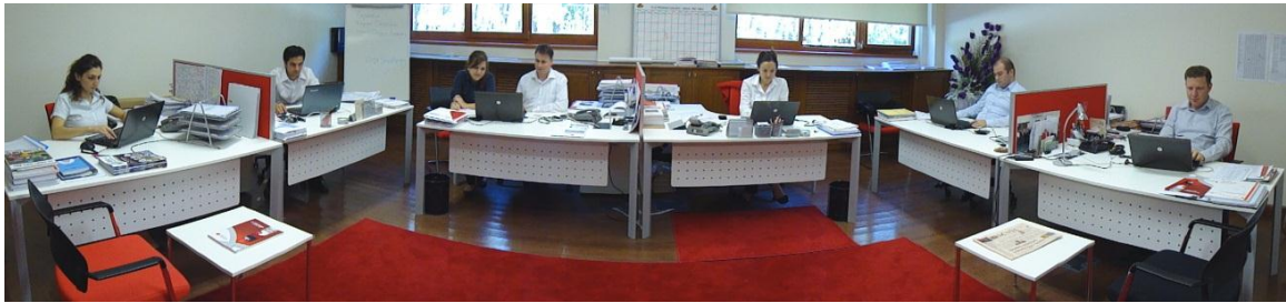
Resim 5 - Planlama, Programlama ve Koordinasyon Birimi