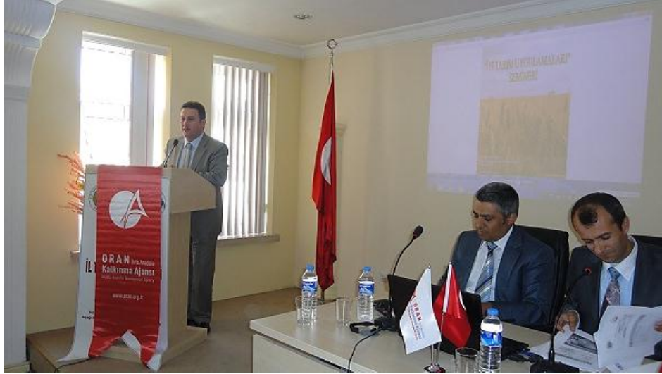
Resim 48 - Yozgat İyi Tarım Uygulamaları Semineri