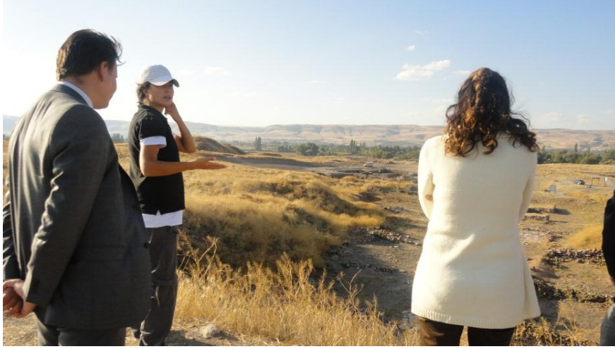
Resim 20 - Kültepe Kaniş Saha Ziyareti