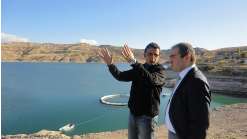
Resim 23 - Alabalık Yetiştirme Tesisi Ziyareti

Su ürünleri sektörünü yakından tanımak ve yerinde incelemek amacıyla Kayseri Yamula Barajı'nda alabalık yetiştiriciliği yapan bir işletmeye saha ziyareti gerçekleştirildi.