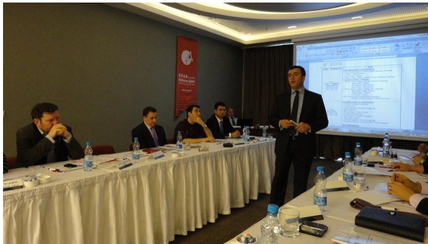
Resim 2 - Fizibilite Etüdü Eğitimi