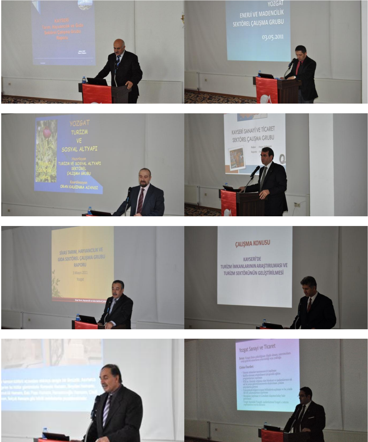
Resim 50 - Sektörel Çalışma Grubu Sunumları