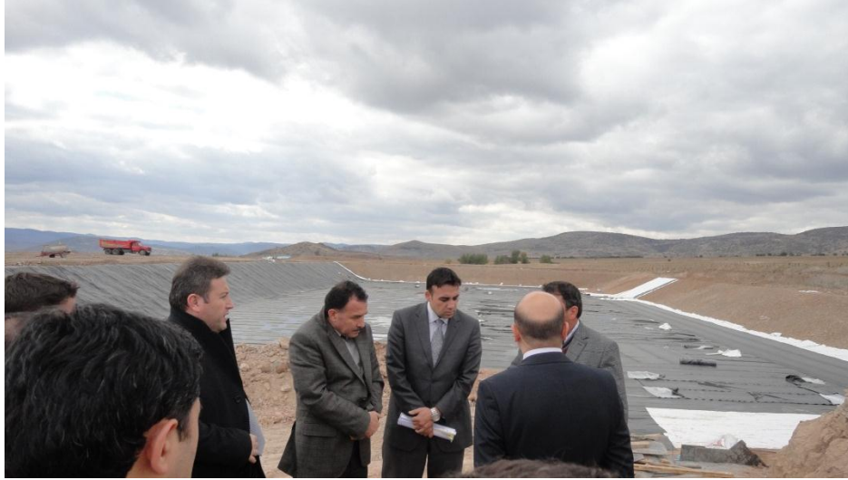
Resim 29 - Deveci Havzası Meyvecilik Entegrasyon Projesi Saha Ziyareti

Deveci Havzası Meyvecilik Entegrasyon Projesi 1. Etap bölümüne ilişkin saha ziyareti yapıldı ve proje hakkında detaylı bilgi alındı.