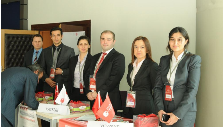
Resim 51 - 2011 Yılı II. Olağan Kalkınma Kurulu Toplantısı

Orta Anadolu Kalkınma Ajansı 2011 Yılı II. Olağan Kalkınma Kurulu Toplantısı 22 Aralık Perşembe günü Kayseri ilinde yapıldı.