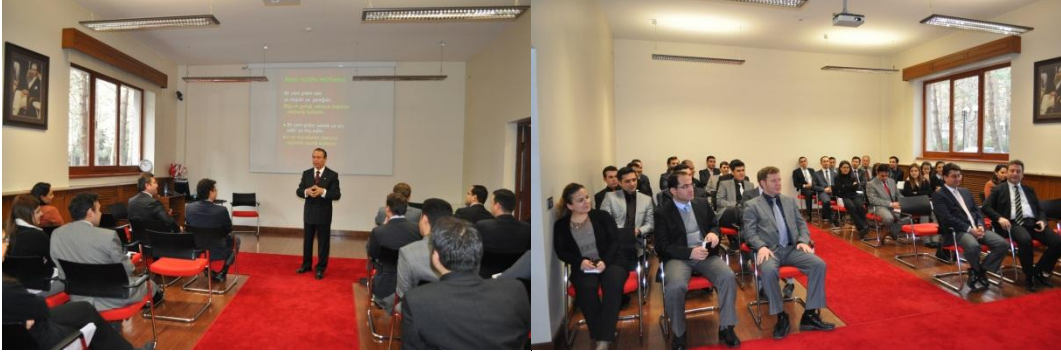
Resim 4 - Protokol Eğitimi