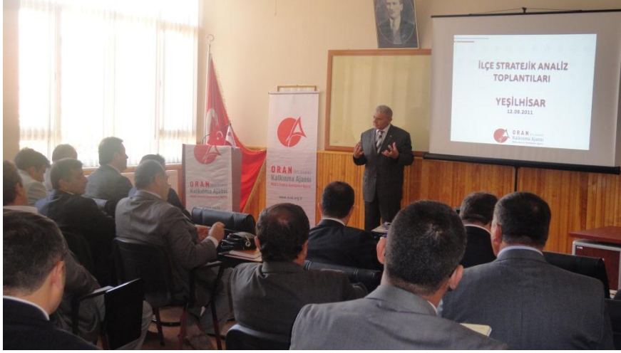
Resim 15 - Yeşilhisar İlçe Stratejik Analiz Toplantısı