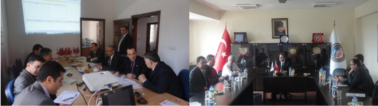
Resim 11 - Sivas, Kayseri Sanayi ve Ticaret Sektörel Çalışma Grubu Toplantıları

Grup üyelerinin tanıştığı, bir başkan ve bir raportörün seçildiği ilk toplantılardan sonra Bölgedeki sanayi ve ticaret genel durumunun, sorunlarının ve bu sorunların çözümüne yönelik yapılması gereken faaliyetlerin tartışıldığı toplantılarda veriler kart tekniği ve anket metodu uygulanarak toplandı. Toplantılar sonunda elde edilen bilgiler Kalkınma Kurulu toplantısında Kalkınma Kurulu üyelerine sunuldu.