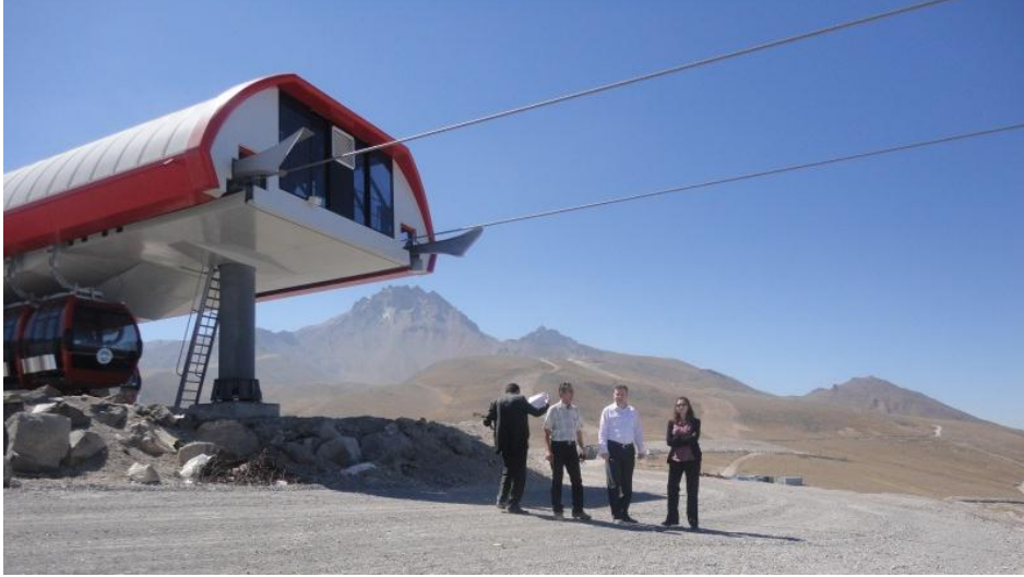
Resim 28 - Erciyes Master Planı Saha İncelemesi