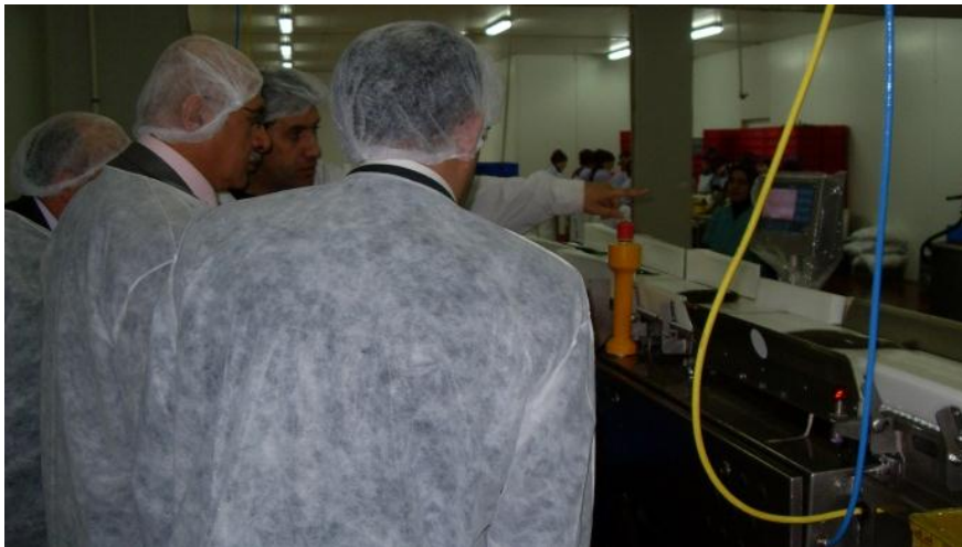
Resim 21 - Kayseri Tarım, Hayvancılık ve Gıda Sektörel Çalışma Gurubu ile Saha Ziyaretleri