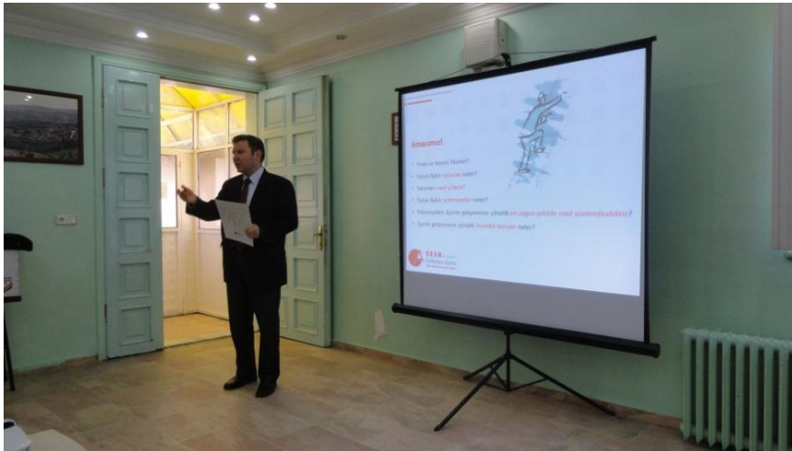
Resim 17 - Çayıralan İlçe Stratejik Analiz Toplantısı