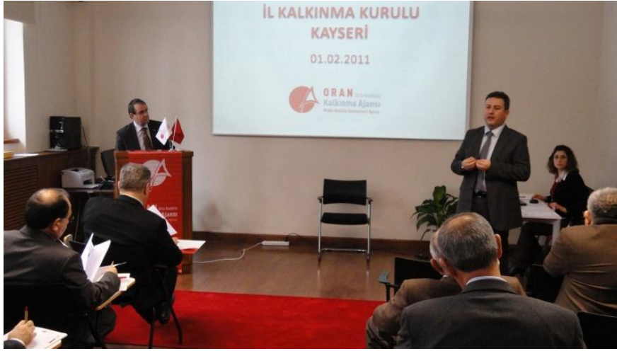
Resim 6 - Kayseri İl Kalkınma Kurulu