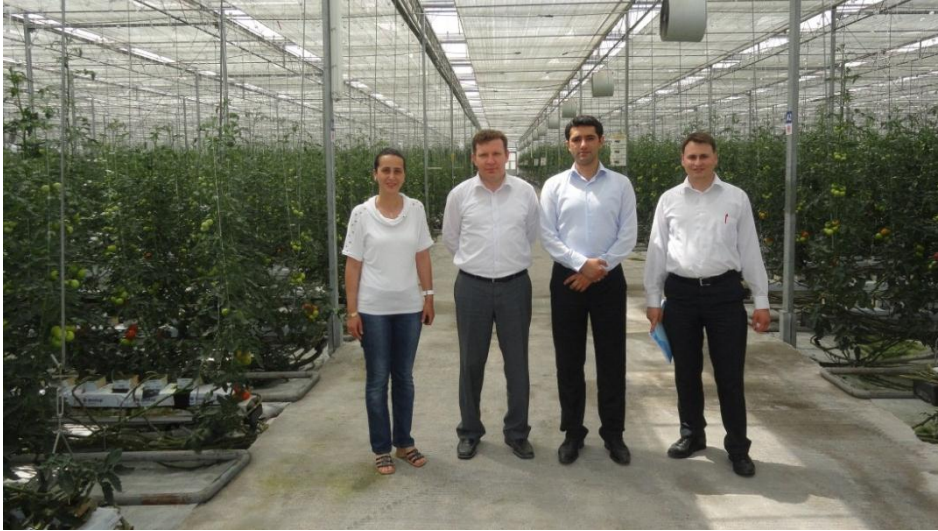
Resim 27 - Kayseri Şeker Fabrikası A.Ş. Serası Ziyareti

Seracılıkla ilgili inceleme ve araştırma faaliyetleri çerçevesinde Kayseri Şeker Fabrikası A.Ş. serası ziyareti gerçekleştirilmiştir.