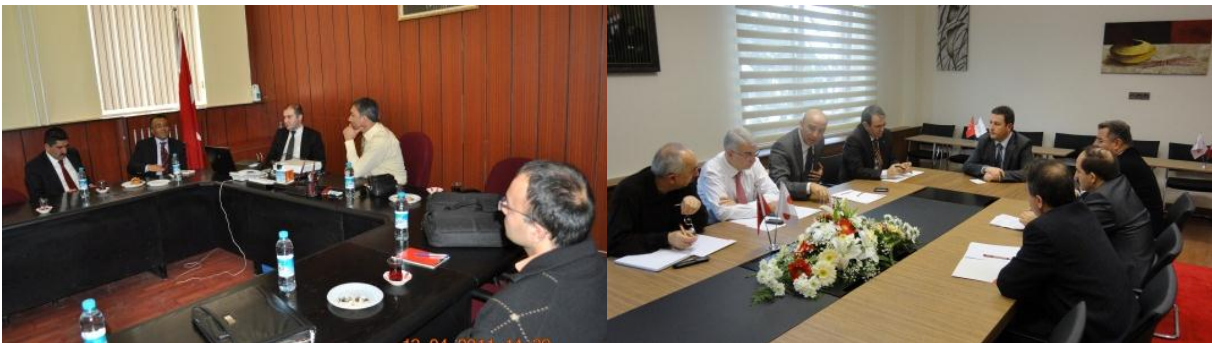
Resim 12 - Yozgat ve Kayseri Sanayi ve Ticaret Sektörel Çalışma Toplantıları