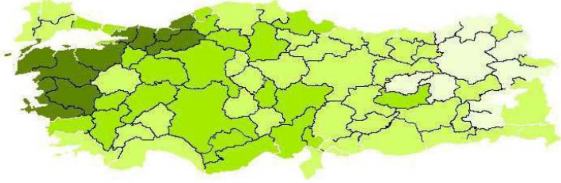
Şekil 3- Kümes Yoğunluğu